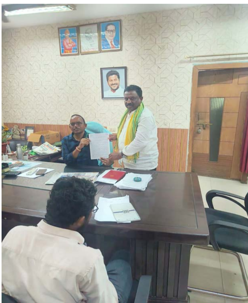
సమస్యలను ప్రత్యక్షంగా పరిశీలించి,డ్రైనేజీ మరమ్మతులు,రోడ్ల అభివృద్ధి,చెత్త తొలగింపు,స్కూలు వాటికల అభివృద్ధి,వీధి కుక్కల నియంత్రణ,వీధి దీపాల ఏర్పాటు,ఇతర ప్రజా సమస్యల పరిష్కారానికి తక్షణ చర్యలు తీసుకోవాలని ఆయన విజ్ఞప్తి చేశారు.