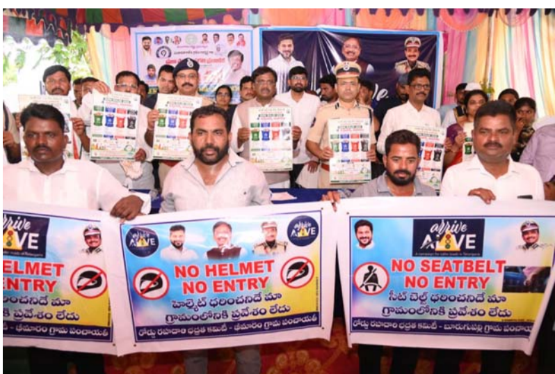
భీమారంలో సీసీ కెమెరాల ప్రారంభం..