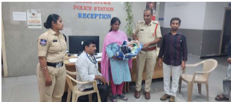
తదుపరి దర్యాప్తుకై నందిగూడ పి.ఎస్ కు బదిలీ.