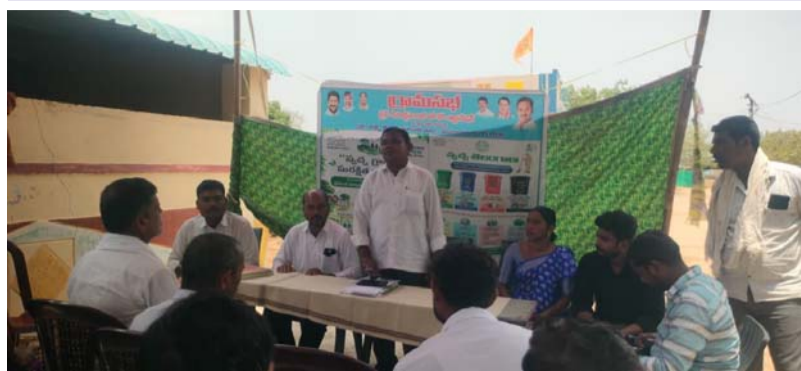
అభివృద్ధికి ప్రతి ఒక్కరూ సహకరించాలి..