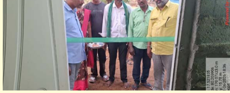
రావోజీ తండా గ్రామంలో ఘనంగా ఇందిరమ్మ ఇంటి గృహప్రవేశం..