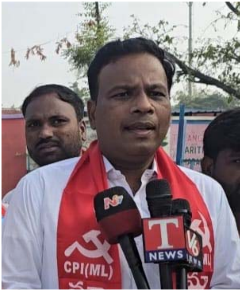
అడ్డుకట్ట వేయగలమని ఆయన అభిప్రాయపడ్డారు. ఈ ఘటనపై జిల్లా యంత్రాంగం, పోలీసు ఉన్నతాధికారులు ప్రత్యేక దృష్టి సారించి బాధిత కుటుంబానికి న్యాయం జరిగేలా చర్యలు తీసుకోవాలని సిపిఐ(ఎంఎల్) మాన్ లైన్ పార్టీ తరపున డిమాండ్ చేశారు.