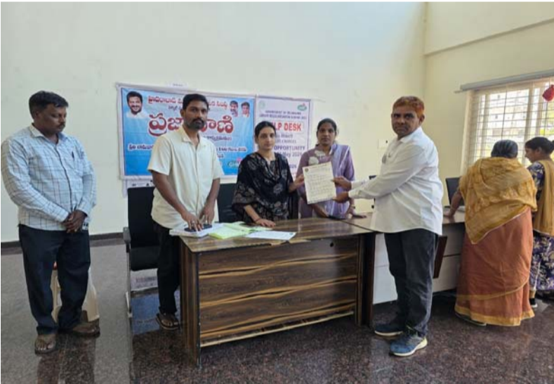
ప్రజాధనం పుధా కాకుండా చూడాలి.. కామన్ ఫోలో ఫాం ఎన్టీఓ క్రాంతిచర్చు

రాజేంద్రనగర్, జూన్ 01 (సూర్యరేఖ) ప్రేమావతిపేట మోడల్ మార్కెట్ ను పునరుద్ధరించాలని, ప్రజాధనం పుధా కాకుండా చూడాలని కామన్ ఫోలో ఫాం ఎన్టీఓ క్రాంతిచర్చు అన్నారు. తొమ్మిదేళ్లుగా మూతపడడంతో కోట్ల ప్రజాధనం పుధా అవ్వడమే కాకుండా అసాంఘిక కార్యకలాపాలకు అడ్డాగా మారిన అవేదన వ్యక్తం చేశారు. ఈ మేరకు ఆయన మున్సిపల్ కార్యాలయంలో వినతిపత్రం అందజేశారు. ఈ సందర్భంగా ఆయన మాట్లాడుతూ.. కోట్లాది రూపాయల ప్రజాధనంతో 9 సంవత్సరాల క్రితం రాజేంద్రనగర్ ప్రేమావతిపేటలో అత్యాధునిక వసతులతో నిర్మించిన మోడల్ మార్కెట్ ఇప్పటివరకు తెరవకపోవడం పట్ల స్థానిక ప్రజలు, స్వచ్ఛంద సంస్థలు తీవ్ర ఆగ్రహం వ్యక్తం చేస్తున్నారన్నారు. ప్రజల సౌకర్యం కోసం కట్టిన ఈ భవనం నేడు దుమ్ముధూలితో శిథిలావస్థకు చేరిందన్నారు. తాళాలు వేసి ఉండడం వల్ల వెలుతురు, నిర్వాహణ లేక చిమ్మిచీకటిగా మారి మందుబాబులకు, అసాంఘిక శక్తులకు అడ్డాగా మారినదన్నారు. ఇది ప్రజాధనాన్ని పుధా