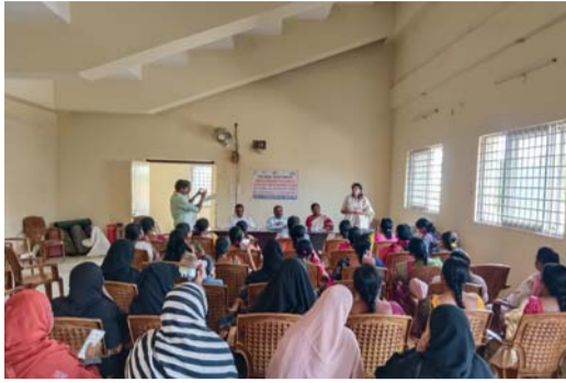
ప్రజాపాలనలో ప్రజలకు ప్రభుత్వ పథకాలు చేరువ..