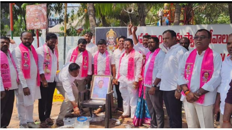
కాంగ్రెస్ తో విసిగిన ప్రజలు..