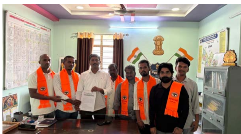
గోమాతల సంరక్షణకు కఠిన చర్యలు తీసుకోవాలని డిమాండ్ చేస్తూ రామాయంపేటలో విశ్వహిందూ పరిషత్ కార్యకర్తలు వాల్ పోస్టర్ విడుదల చేసి, స్థానిక అధికారులకు మెమోరండం సమర్పించారు.