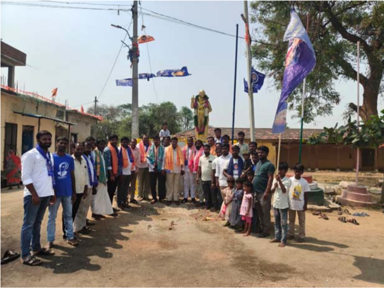
రాజ్యాంగ రూపకర్త ఊరు వాడల నిరాజనాలు

కొల్చారం, ఏప్రిల్ 14 (సూర్యరేఖ) ఊరు వాడల చిన్న పెద్ద, కులమాతాల అతీతంగా, పార్టీల అతీతంగా అందరూ సందడిగా చేరి ప్రతి గ్రామంలో పండగను తలపించేలా మొదటి న్యాయశాఖమంత్రి, భారత రాజ్యాంగా నిర్మాణకుడు డాక్టర్ భీంరావ్ అంబేద్కర్ 135వ జయంతి ఉత్సవాలు ఓగోపు వేడుకగా చేసుకున్నా ప్రజానికం. కొల్చారం మండలంలోని చిన్నఘణా పూర్, రంగంపేట, యెనగండ్ల, కోనాపూర్, తుక్కపూర్, సైతర, సదాశివనగర్, సంగాయిపేట, వరిగుంతం, కొల్చారం, అంసానిపల్లి, పోతాన్