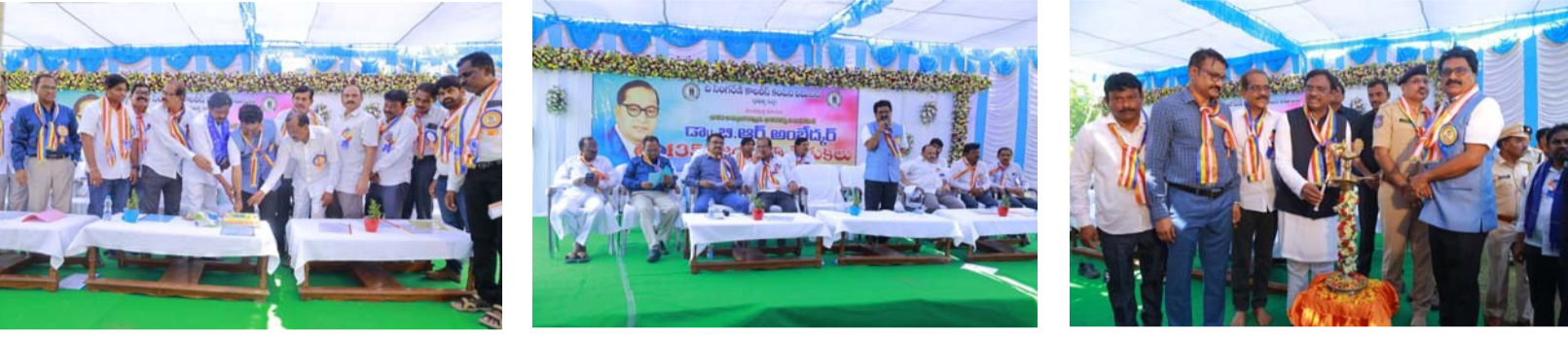
కార్యక్రమం సింగరేణి ఆధ్వర్యంలో ఘనంగా డా.బి.ఆర్. అంబేద్కర్ 135వ జయంతి వేడుకలు