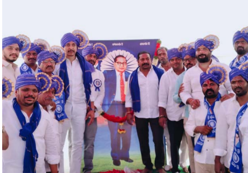
ఎస్సీ రిజర్వేషన్ల వర్గీకరణ చేసిన ఘనత సీఎం రేవంత్ రెడ్డికే దక్కుతుంది