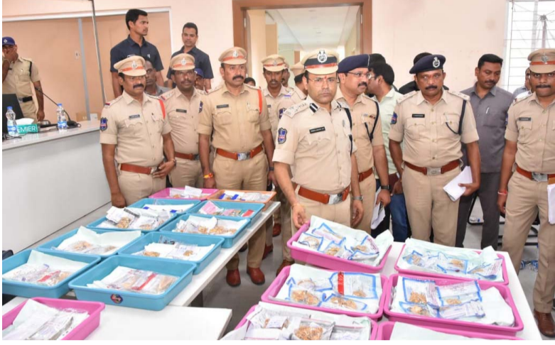
44 మంది నిందితులు అరెస్ట్.. 15.237 కిలోల బంగారు నగలు, రూ.1,61,730 నగదు స్వాధీనం..