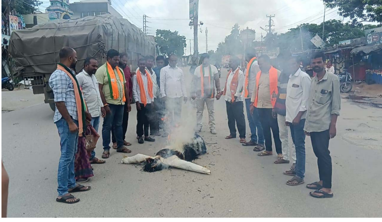
మోడీ తల్లిపై వ్యాఖ్యలపై ఆగ్రహం.. బీజేపీ నేతల నిరసన..

రామాయంపేట,ఆగస్టు31(సూర్యరేఖ) బీహార్ ఎన్నికల ప్రచారంలో కాంగ్రెస్ ఎంపీ రాహుల్ గాంధీ ప్రధాన మంత్రి నరేంద్రమోదీ తల్లిపై చేసిన అసభ్యకర వ్యాఖ్యలపై దేశవ్యాప్తంగా నిరసనలు వ్యక్తమవుతున్నాయి. ఈ వ్యాఖ్యలను తీవ్రంగా ఖండిస్తూ రామాయంపేట మున్సిపాలిటీ మరియు మండల బీజేపీ ఆధ్వర్యంలో ఆదివారం రాహుల్