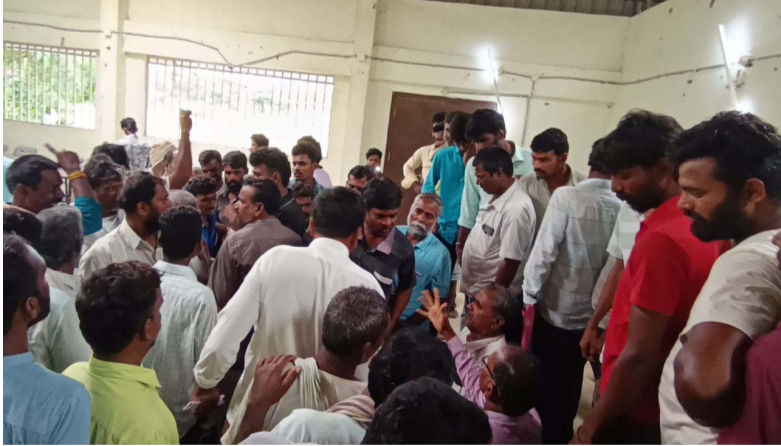
తోపులాట మధ్య ఒకరికి రెండు బస్తాల యూరియా సరఫరా..

కొల్చారం, ఆగస్టు 31 (సూర్యరేఖ) యూరియా ముందు కోసం రైతన్నలు కోటి తిప్పలు పడాల్సిన అవసరం వచ్చిందని, వివిధ గ్రామాల రైతన్నలు వారి ఆవేదన వ్యక్తం చేశారు. గత 15 రోజులుగా కొల్చారం మండలానికి యూరియా రాకపోవడంతో శనివారం రంగంపేటలో రైతులు రాస్తారోకో చేసిన విషయం తెలిసింది. ఈ నేపథ్యంలో ఆదివారం కొల్చారం మండలంలోని రంగంపేట సహకార సంఘం, కొల్చారం సహకార సంఘం దుంపలకుంట అగ్రోస్ రైతు సేవ కేంద్రాలకు మూడు లారీల యూరియాను అధికారులు సరఫరా చేశారు. దీంతో మండలంలోని వివిధ గ్రామాల రైతులు పెద్ద ఎత్తున రంగంపేట