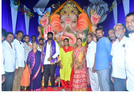
బోర్డ్, నేతాజీ నగర్ బాబుల్ రెడ్డి నగర్ మార్కెట్ యన్ నగర్, పరిసర ప్రాంతాల్లో వినాయక నవరాత్రు ఉత్సవాలలో భాగంగా విఘ్నేశ్వరుడి ప్రత్యేక పూజ అన్నదానం నిర్వహించారు. ఈ కార్యక్రమంలో రాజేంద్రనగర్ నియోజకవర్గ ఇంచార్జ్, డివిజన్ కార్పొ